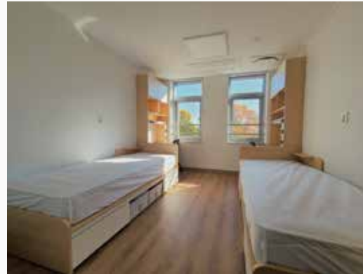
2인실(개인 화장실 보유, 각 층별 공용주방 보유) 1,230,000원/학기(15주)