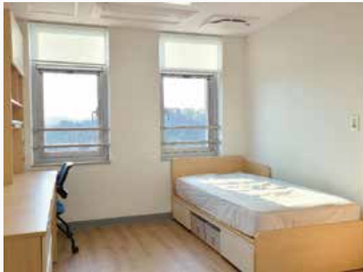
1인실(개인 화장실 보유, 층 마다 공용주방 보유) 1,870,000원/학기(15주)

학교 내부 기숙사 | 1~4인 | 24시간 경비 시스템 구축 | 엘리베이터 운행 | 헬스장등 다양한 편의시설