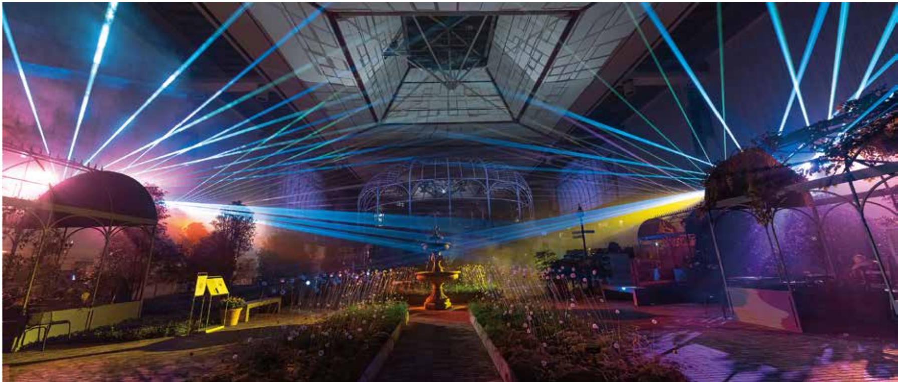
Art Of The Future@The HYUNDAI Seoul_2022 - 윤제호 교수 -